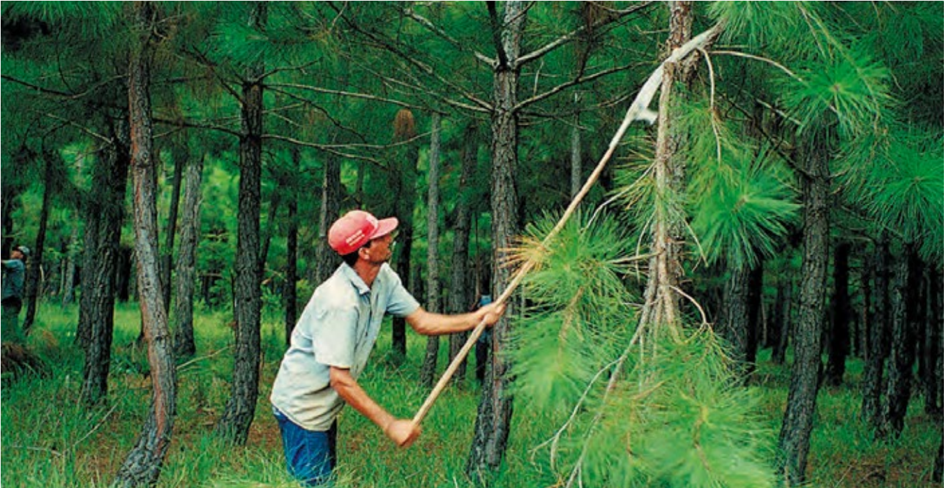
Al proyecto también se han vinculado productores de otros municipios del departamento como El Piñón, Pivijai, Pedraza y Chibolo.

En varios departamentos de la costa Atlántica ya es común encontrarse con alianzas productivas estratégicas entre los productores del sector agropecuario y las empresas que demandan productos para el procesamiento agroindustrial y que quieren que sus proveedores sean los 'dolientes' de sus propios proyectos.