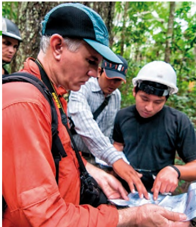
El sector forestal reclama por seguridad jurídica y un marco regulatorio más claro.

Para esto, dice la propuesta, se hace necesario que estos bosques sean explotados de manera sostenible, con la puesta en marcha de procesos FLEGT, es decir, los que ayudan a combatir el comercio ilegal de la madera.