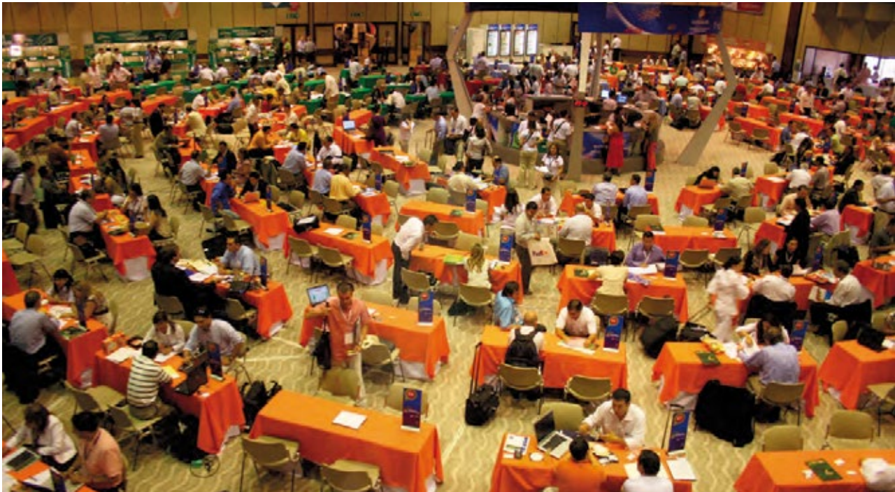
Las ruedas de negocios han demostrado ser una de las herramientas más efectivas para concretar negocios en todos los sectores económicos.

Para los próximos meses, la actividad comercial del sector tiene dos opciones interesantes que desde el gremio le recomendamos: la primera, una feria comercial organizada por Proexport, entidad que ha venido apoyando de forma sostenida la participación de todos los sectores productivos del país a través de su sistema de ruedas de negocios.