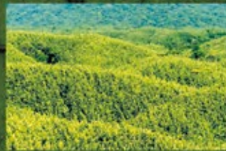
Management de Patrimonios Forestales