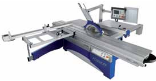
Sierra Circular 40 X-MOTION FELDER - FORMAT 4