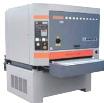
Lijadora, calibradora Industrial BULLDOG HOUFEK