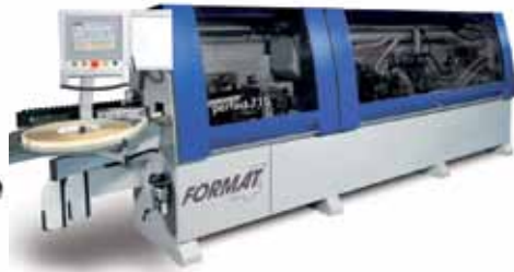
Enchapadora de Cantos PERFECT 710 FELDER - FORMAT 4