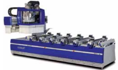
Centro de Mecanizado PROFIT H20 FELDER - FORMAT 4