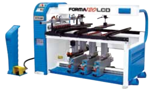
Taladro múltiple 120LCD VITAP