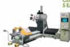
CENTRO DE MECANIZADO 5 EJES PARA SILLAS