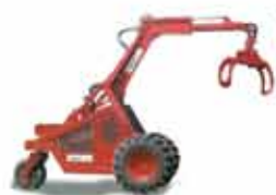
TRACTOR FORETAL GRUAS FORESTALES