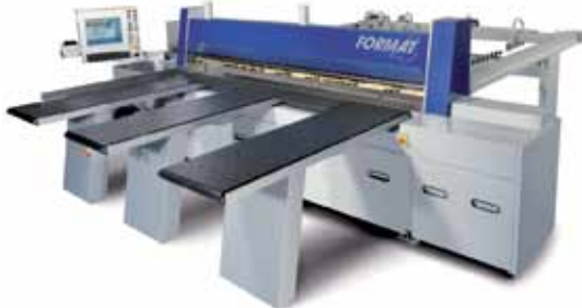
Seccionadora KAPPA 3200 atomática FELDER - FORMAT 4