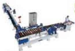
FINGER JOINT OPTIMIZADORAS