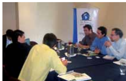
Foto: Representantes de las empresas afiliadas Núcleos de Madera y Tablemac junto a representantes de la Fundación Un Techo para mi País.

Por otra parte el 23 de febrero se llevó a cabo en el mismo Hotel, el encuentro Fundación Un Techo para mi País – FEDEMADERAS con el objeto de contactar y registrar proveedores para la elaboración de casas de emergencia en madera; al evento asistieron seis (6) empresas afiliadas.