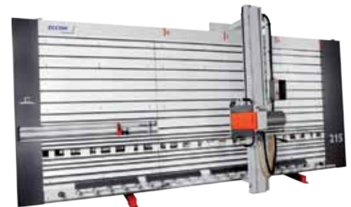
Sierra vertical ELCON