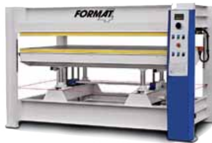
Prensas FORMAT 4 HVP FELDER - FORMAT 4