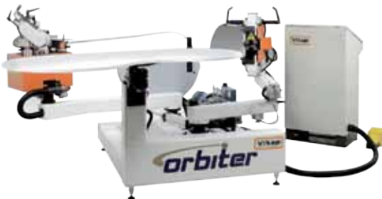
Enchapadora de cantos curvos VITAP