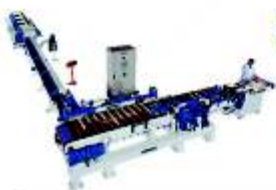
FINGER JOINT OPTIMIZADORAS