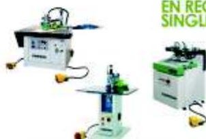
EQUIPOS PARA ENCHAPE EN RECTOS Y CURVOS SINGLE - SPEEDY - F21