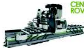
CENTROS DE MECANIZADO ROVER