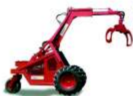
TRACTOR FORETAL GRUAS FORESTALES