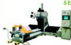
CENTRO DE MECANIZADO 5 EJES PARA SILLAS