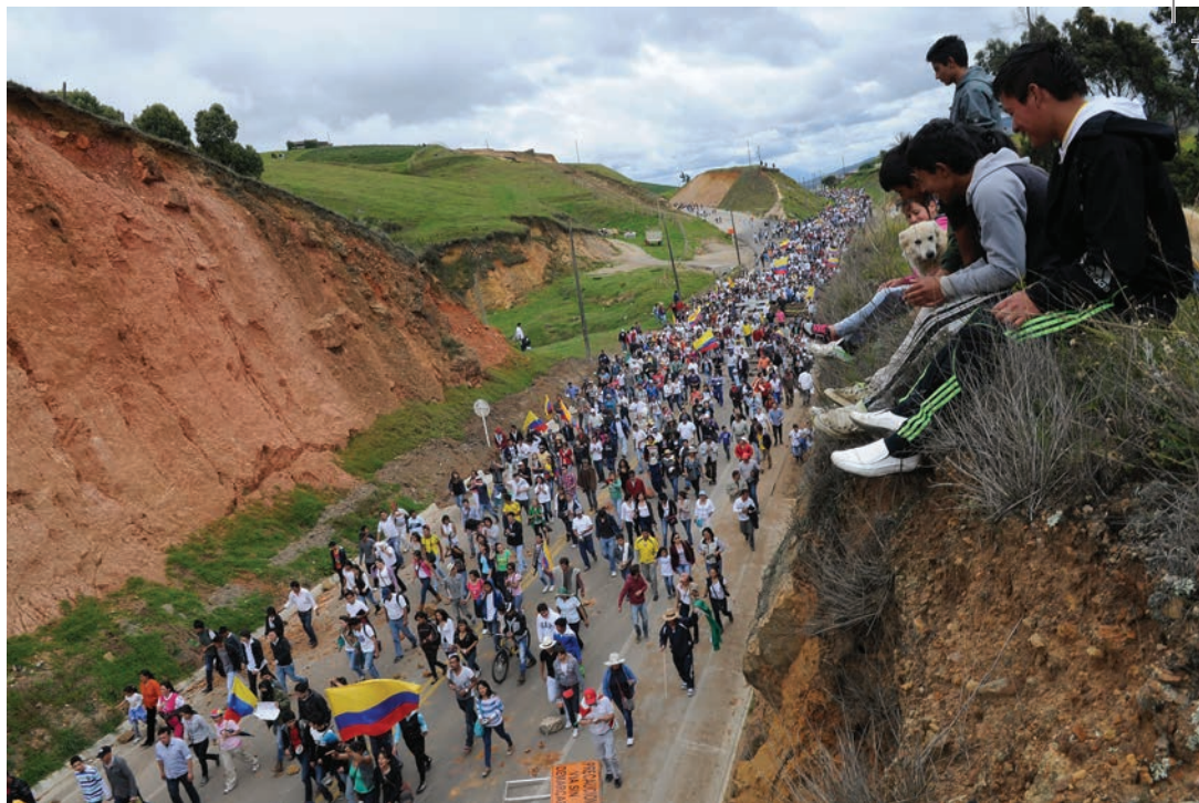
Marcha campesina por las carreteras del país.

En algunos apartes, dice que el Ministerio necesita una alta cirugía porque está descuadrado... no tiene la capacidad de verificar sus programas. Así mismo, las entidades adscritas tienen dificultades para poner en marcha lo planeado.