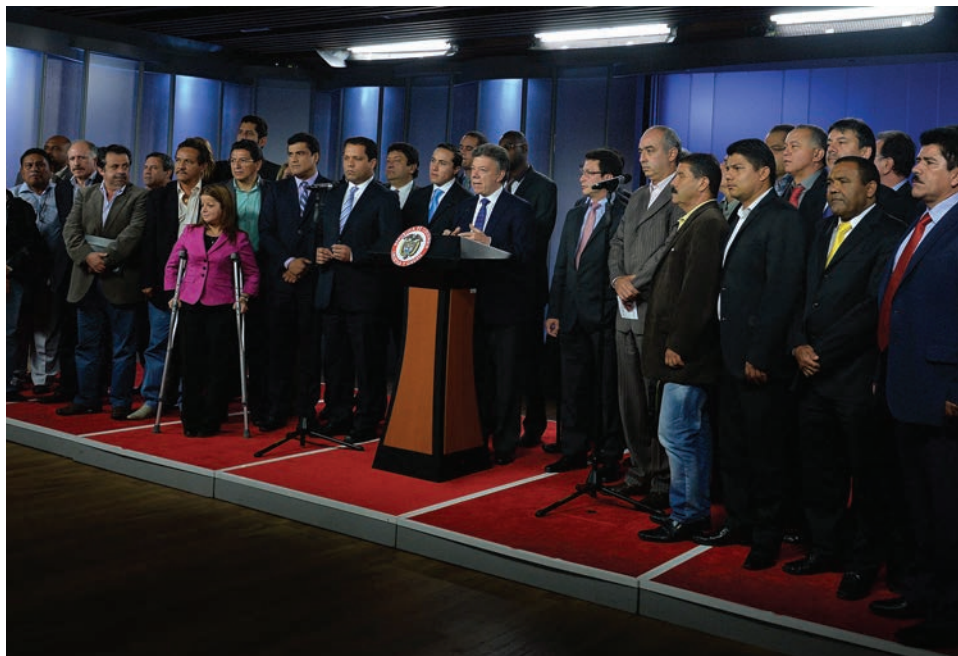
Alcaldes y gobernadores también apoyan la búsqueda de una política para el agro.

Agrega que el campo necesita políticas de corto y de largo plazo. En el corto plazo no queda solución diferente a darle un valor de compra mínimo a los agricultores del sector arrocero, papero y lechero, a pesar del importantísimo costo fiscal que eso implica. Eso sí, esa ayuda... tiene que estar atada a la exigencia de que los campesinos demuestren la voluntad de asociarse