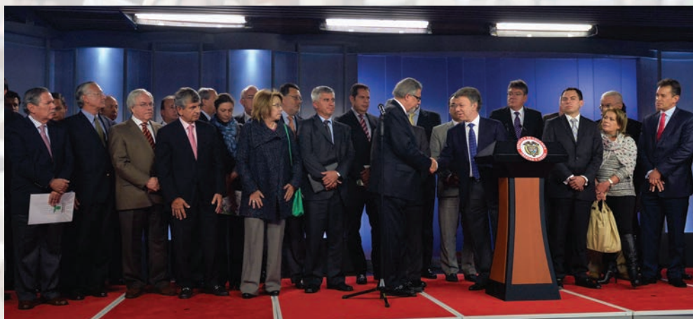
Respaldo gremial al Pacto recibió el Presidente Santos.

Incluso hijos de campesinos que ahora están en la ciudad recordaron cómo en época de elecciones los políticos acudían a los líderes rurales para ofrecerles apoyo y éstos se ilusionaban porque ahora sí las cosas iban a cambiar, pero pasados los escrutinios, los olvidaban.