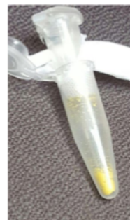
Figura 1. Polen de teca limpio después de tamizado y extraído de las anteras secas.

De cada árbol seleccionado, se cortaron varias panículas en la mañana (5:30 a 6:30 am) para proceder a la extracción de su polen. Cada día de trabajo se colectó panículas de al menos 4 o 5 árboles (machos). Las panículas se conservaron separadas en bolsas plásticas de jardín, con el propósito de mantener la temperatura y la humedad alta, de modo que no se interrumpiera el proceso natural de apertura floral. Aproximadamente dos horas después (8 am) se cortó con tijera fina un número suficiente de flores por panícula, que ya