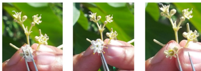
Figura 3. Proceso de emasculación de flores en la polinización controlada de teca.