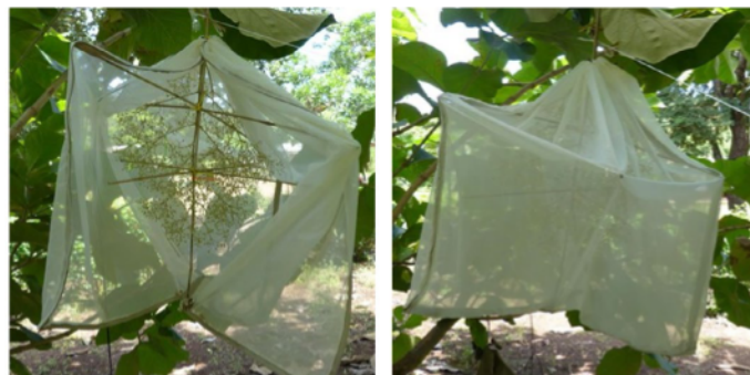
Figura 2. Diseño de embolsado de la panícula de teca para su aislamiento de polinizadores.

Para realizar el ensayo, se procedió de la misma