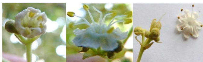
Figura 6. Proceso de apertura y cierre floral en teca. La flor inicia su apertura entre 6 y 7 am (izquierda); flor con máxima receptividad de polen entre 9 y 1 pm (centro); flor ya polinizada entre 2 y 3 pm (derecha).