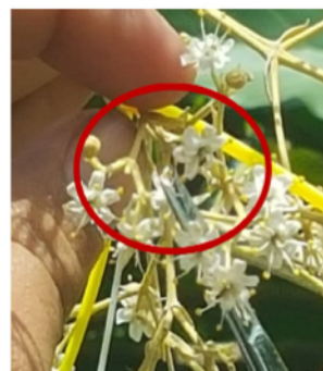
Figura 5. Corte de estilo de flores de teca para realizar la polinización controlada.

El procedimiento experimental en todos los ensayos se realizó diariamente con polen procedente de 4 o 5 machos. Con el lote de polen se polinizó en grupos de 8 flores (ramillete) hasta completar de 32 a 40 flores receptivas. Por lo tanto, estadísticamente cada día de polinización se constituyó en una repetición. Todos los ensayos de polinización se repitieron de nuevo en días diferentes, a veces con árboles receptores (hembra) y machos (polen) diferentes y en años diferentes. Por tanto, cada uno de los ensayos de polinización fue repetido en el tiempo al menos 4 a 5 veces. Con