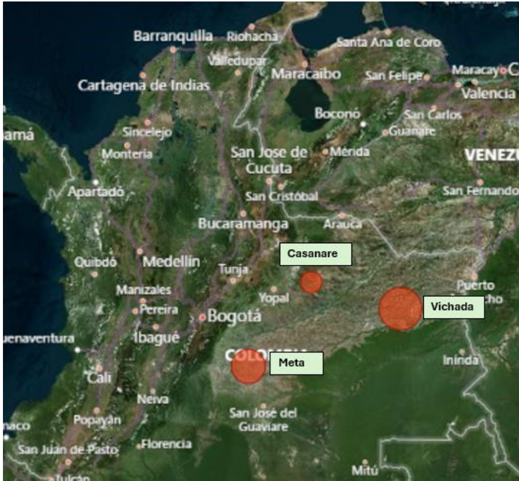
Imagen 1. Mapa de distribución geográfica por departamento de miembros Seccional Orinoquia.