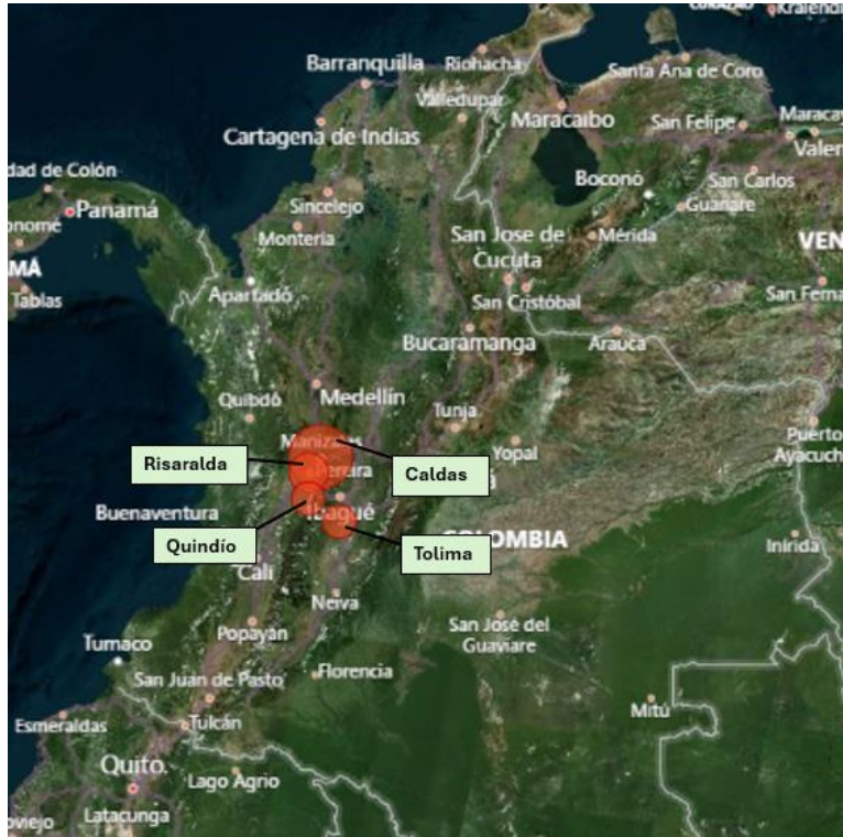
Imagen 1. Mapa de distribución geográfica por departamento de agremiados de la Seccional Eje Cafetero